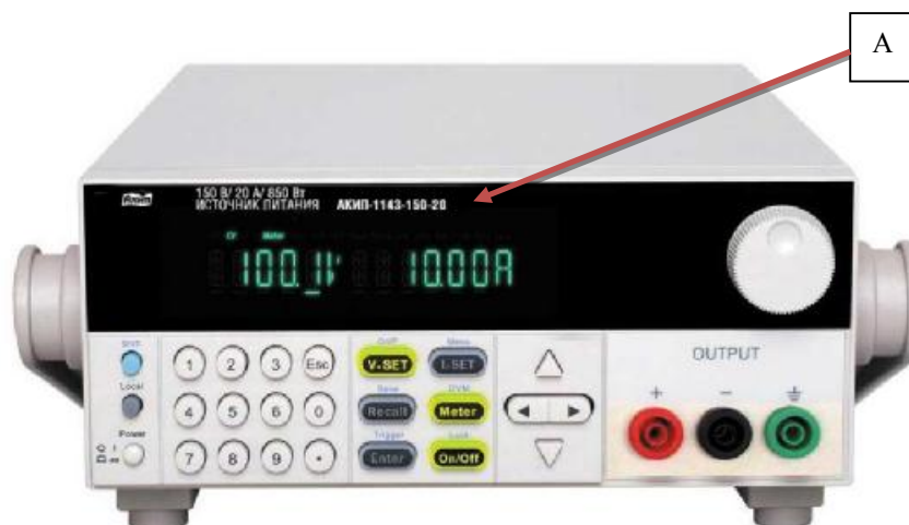
Рисунок 1 - Внешний вид источников питания серии 1143 и схема нанесения знака утверждения типа (А)

Внешний вид источников представлен на рисунках 1 - 4. На рисунке 5 приведена схема пломбировки от несанкционированного доступа. Пломбировка наносится на один из крепежных винтов на задней панели источников. Знак поверки представляет собой наклейку. Знак поверки наносится на боковой панели корпуса источников.