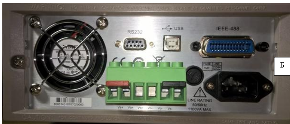
Рисунок 5 - Схема пломбировки от несанкционированного доступа (Б)