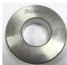
Рисунок 4 - Кольцо установочное