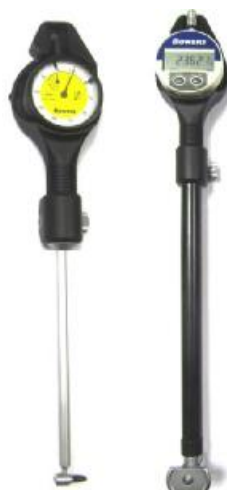
Рисунок 2 - Общий вид нутромеров моделей TGB и CBGD