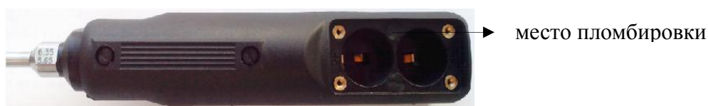
Рисунок 6 - Схема пломбировки нутромеров модели Microgauge