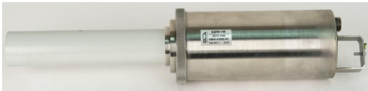
Рисунок 2 - Блок детектирования БДТН-100Д