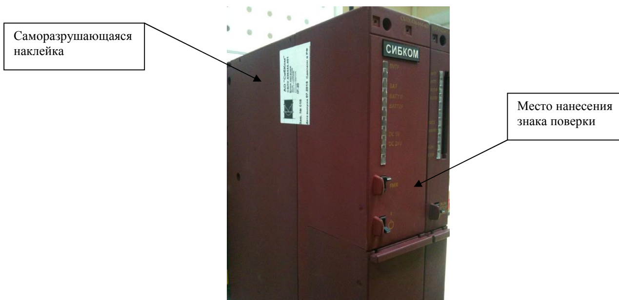
Рисунок 2 - Обозначение мест нанесения знака поверки и пломбировочной наклейки