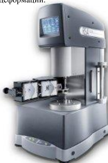
Рисунок 1 - Внешний вид анализаторов динамических механических модификаций RSA-G2 и DMA Q800 (справа RSA-G2)