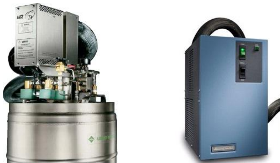
Рисунок 2 - Внешний вид различных охлаждающих устройств

Конструкция анализаторов позволяет определять параметры деформации, температуру фазовых переходов, силу и частоту динамической нагрузки, а также предусмотрена возможность работы в режимах закаливания и деформации. Пломбирование анализаторов не производится.