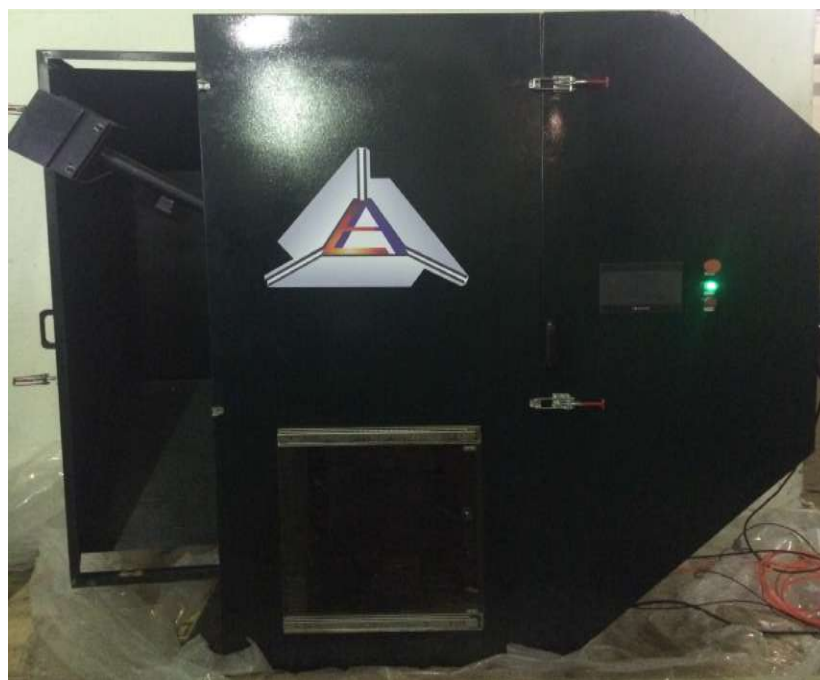
Рисунок 1 - Общий вид копров маятниковых КМ-406, КМ-542

Общий вид копров приведён на рисунках 1 - 2.