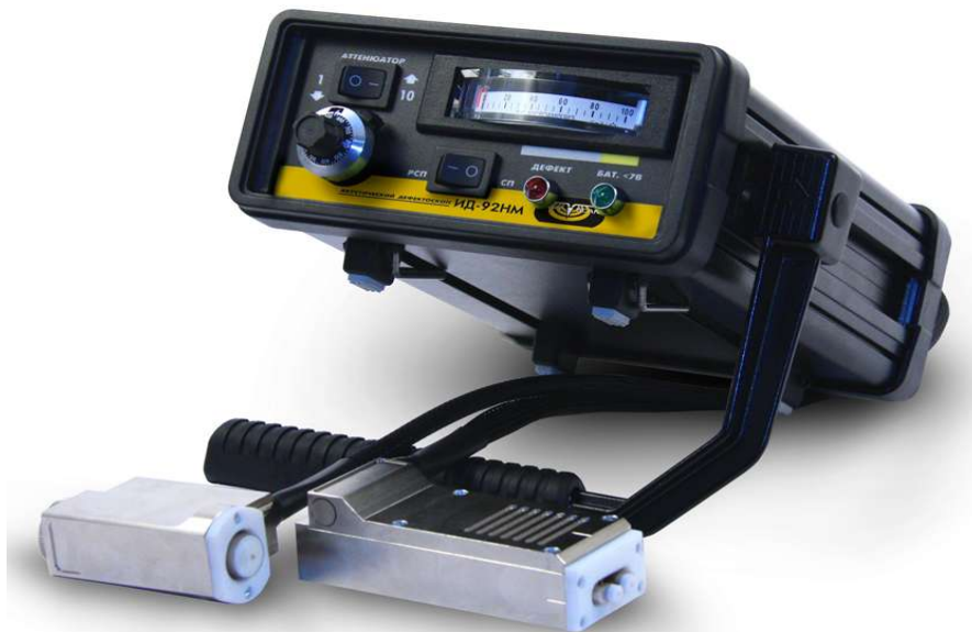
Рисунок 1 - Общий вид дефектоскопов акустические ИД-92НМ АКАСКАН

Схема пломбировки от несанкционированного доступа представлена на рисунке 2. Дефектоскопы пломбируются механически с задней стороны электронного блока.