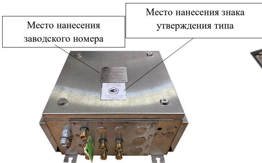
Рисунок 2 - Общий вид устройства сбора данных NGD (вид с закрытой дверцей)