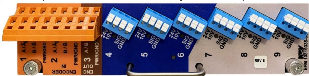
Рисунок 5 – Общий вид сетевого измерительного модуля EFM