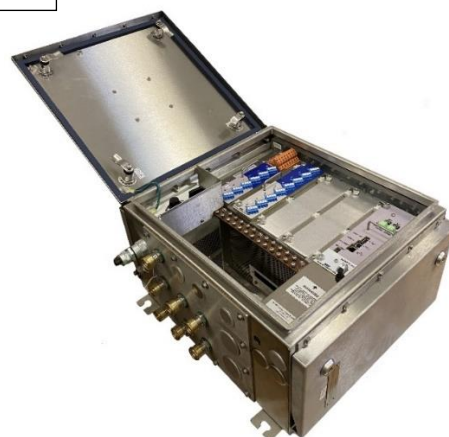
Рисунок 3 – Общий вид устройств сбора данных NGD (вид с открытой дверцей)