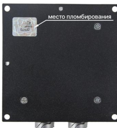
Рисунок 2- Место нанесения пломбы

Место нанесения пломбы представлено на рисунке 2.