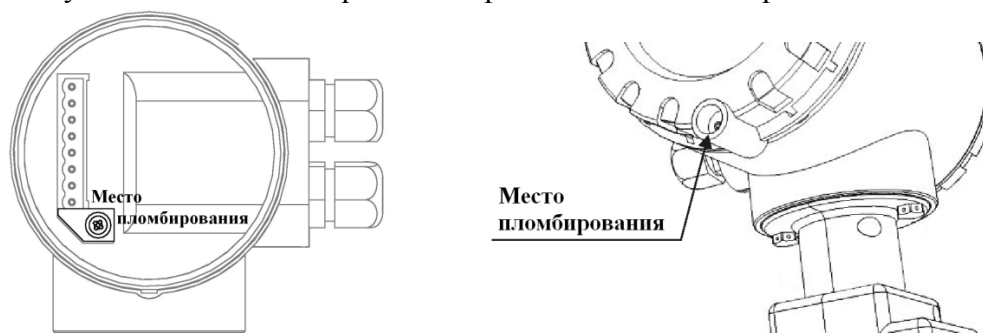
а) исполнение РС, исполнение СВ