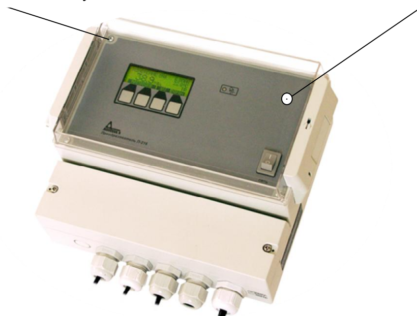
Рисунок 3 - Схема пломбировки от несанкционированного доступа и схема нанесения знака поверки на преобразователи со встроенным входным усилителем

Место пломбировки от несанкционированного доступа