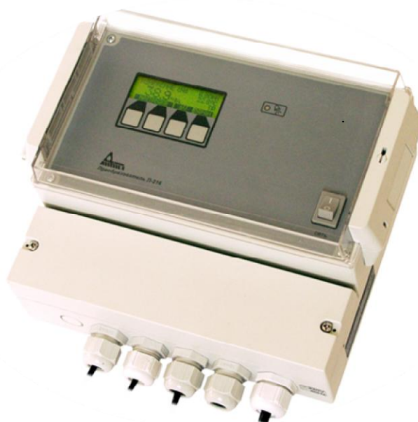
Рисунок 1 - Общий вид преобразователей со встроенным входным усилителем

Схема пломбировки от несанкционированного доступа, обозначение места нанесения знака поверки представлены на рисунках 3 и 4. Для защиты от несанкционированного доступа к измерительным компонентам преобразователей наносится пломба на винт, соединяющий крышку с основанием корпуса, а на усилителях на винт с обратной стороны крышки.