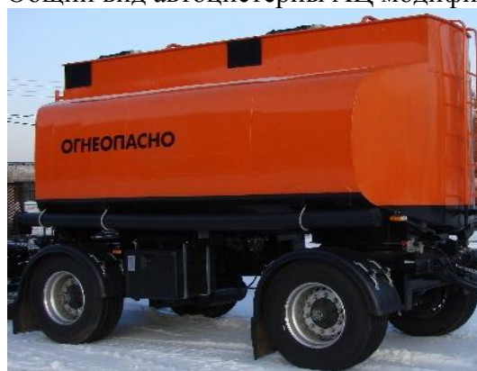
Рисунок 3 - Общий вид прицепа-цистерны ПЦ модификации ПЦ-15