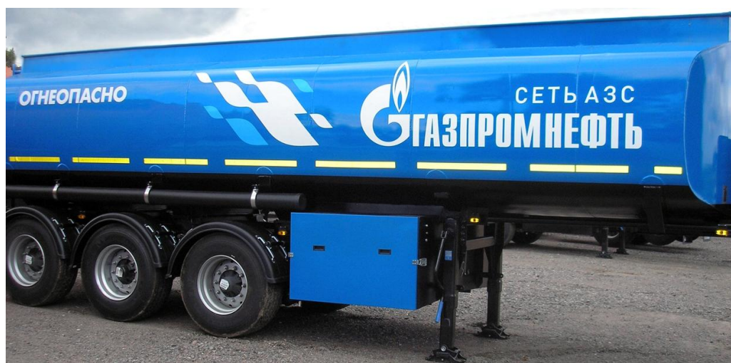
Рисунок 1 - Общий вид полуприцепа-цистерны ППЦ модификации ППЦ-30

Общие виды ППЦ, АЦ, ПЦ представлены на рисунках 1, 2 и 3.