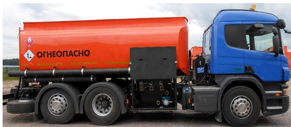
Рисунок 2 - Общий вид автоцистерны АЦ модификация АЦ-15