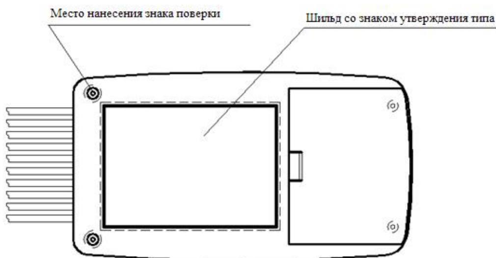
Рисунок 2 - Схема пломбировки и маркировки комплекса