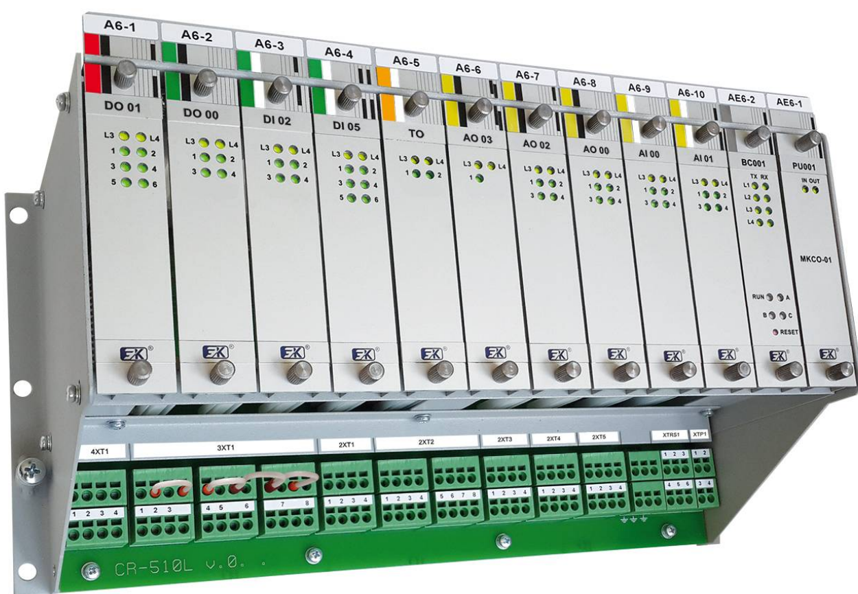
Рисунок 1 - Общий вид контроллера связи с объектом многофункционального МКСО-01

Общие виды контроллеров и модулей ввода-вывода представлены на рисунках 1 и 2 соответственно. Обозначение места нанесения знака поверки в виде наклейки представлено на рисунке 2.