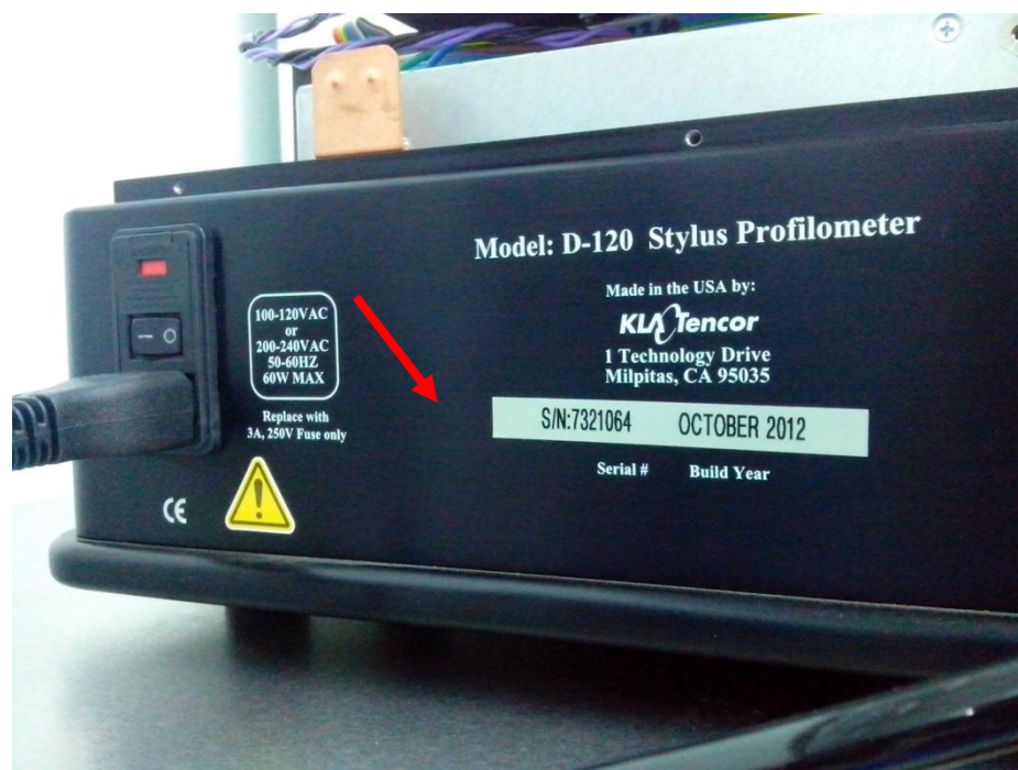
Рисунок 2 - Место нанесения знака поверки