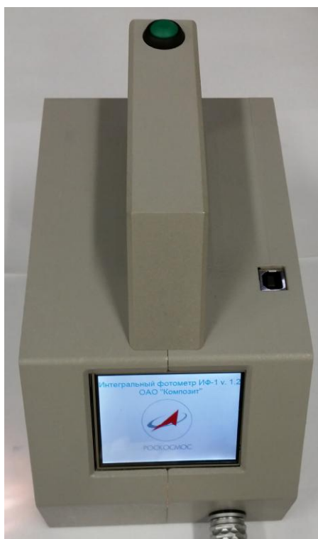
Рисунок 1 - Общий вид рефлектометра

Схема пломбировки от несанкционированного доступа, обозначение места нанесения знака поверки представлены на рисунке 2.