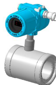
Рисунок 3 - Исполнение типа «сэндвич», уплотнение овальными поверхностями

Общий вид датчика опционального исполнения представлен на рисунке 4.