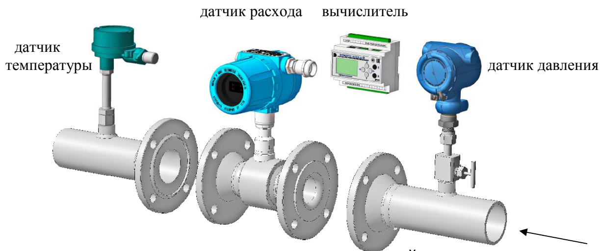
Рисунок 4 - Датчик расхода - счетчик «ДАЙМТИК-1261»

Общий вид датчика опционального исполнения представлен на рисунке 4.