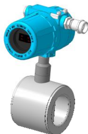
Рисунок 2 - Исполнение типа «сэндвич», уплотнение прокладками или кольцами