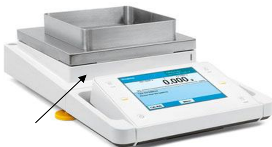
Рисунок 1в - весы AC-5-3