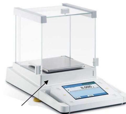
Рисунок 1б - весы AC-1-3