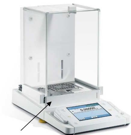
Рисунок 1а - весы AC-200-5

Общий вид весов представлен на рисунках 1а-1г.