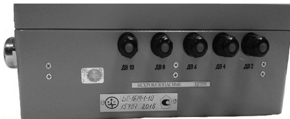
Рисунок 1 - Внешний вид блока согласующего БС-16М