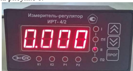
Рисунок 1 - Общий вид измерителя-регулятора ИРТ-4/2

Схема пломбировки от несанкционированного доступа, обозначение места нанесения знака поверки представлены на рисунке 6.