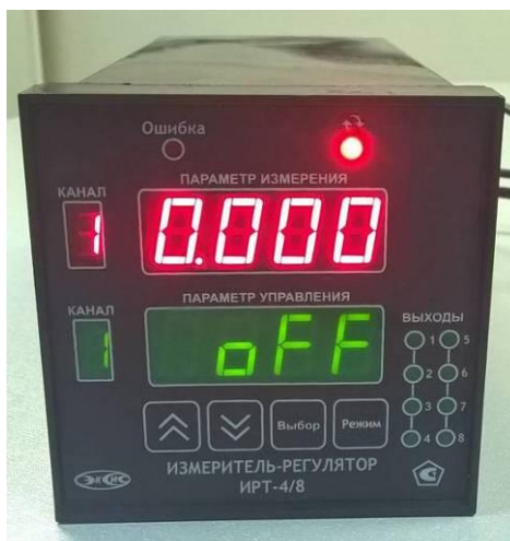
Рисунок 2 - Общий вид измерителя-регулятора ИРТ-4/8