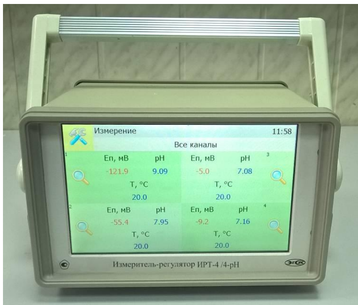
Рисунок 5 - Общий вид измерителя-регулятора ИРТ-4 /Х-pH, исполнение ИРТ-4 /4-pH