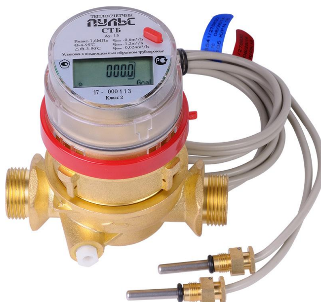
Рисунок 1 – Общий вид теплосчетчиков