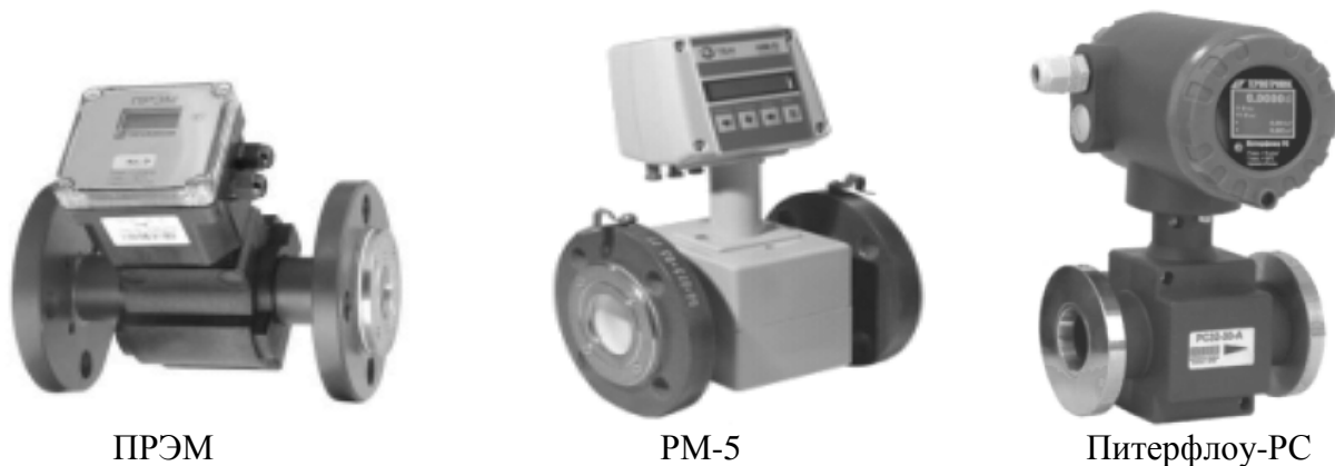
Рисунок 4 - Преобразователи расхода дополнительные