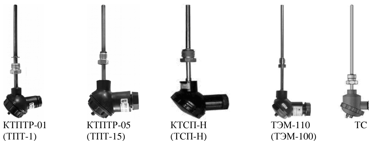
Рисунок 6 - Преобразователи температуры