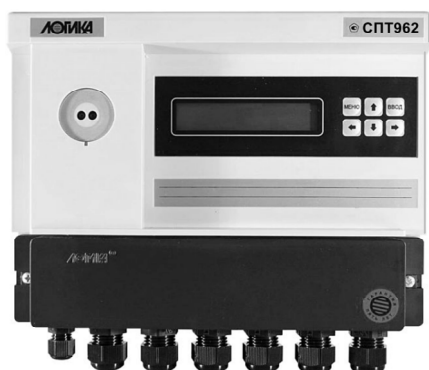
Рисунок 1 - Тепловычислитель СПТ962 (СПТ961)

Общий вид составных частей теплосчетчиков приведен на рисунках 1 - 6.