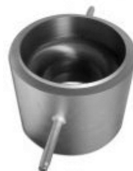
Сопло ИСА 1932