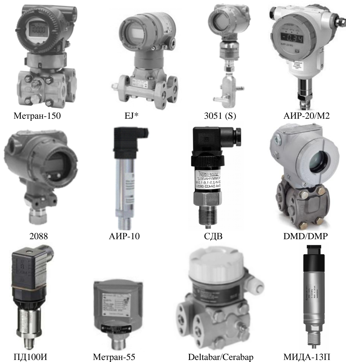
Рисунок 5 - Преобразователи давления (разности давлений)