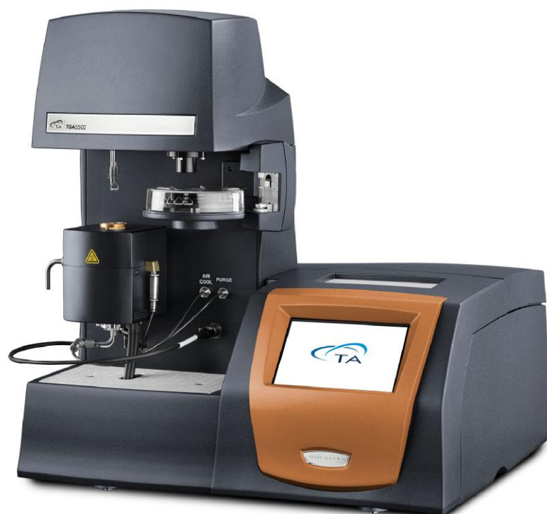
Рисунок 1 – Общий вид термоанализатора Discovery TGA 5500