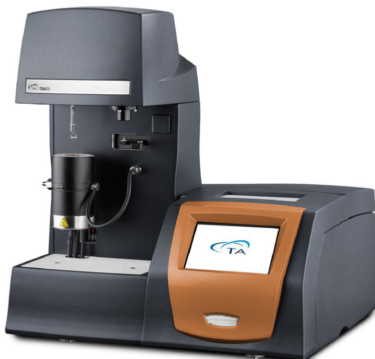
Рисунок 3 – Общий вид термоанализатора Discovery TGA 55