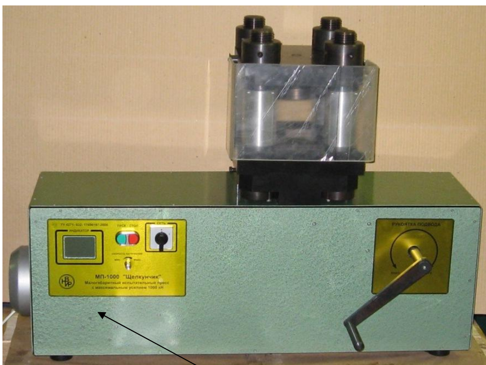
Место нанесения знака поверки