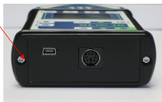
г) Торцевая панель ИИБ, вид снизу