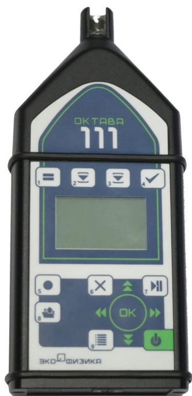
а) Лицевая панель ИИБ