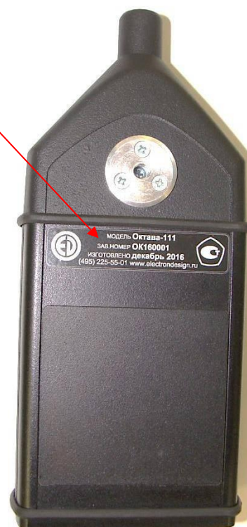
б) Задняя панель ИИБ