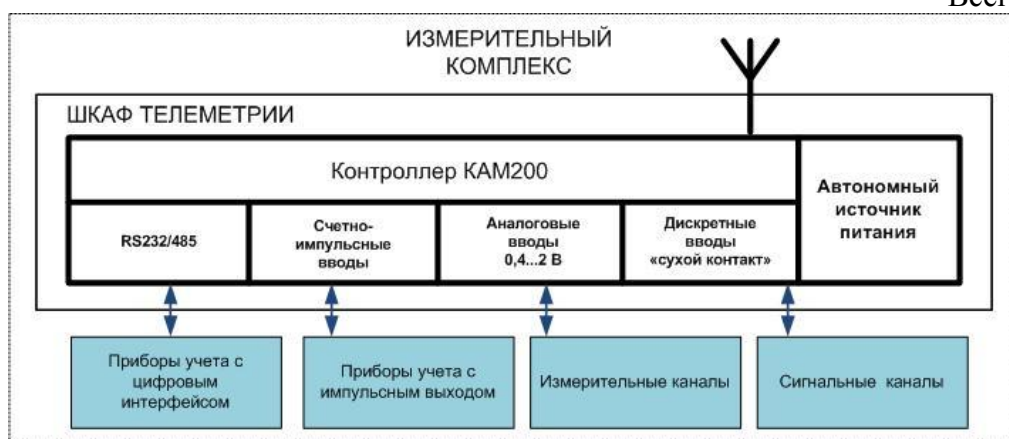
Рисунок 1 – Измерительный комплекс АСУПВ

Полученные данные отправляются на сервер сбора информации, затем могут использоваться внешними сервисами (SCADA-системы, отчетные системы, биллинговые сервисы и т.д.).