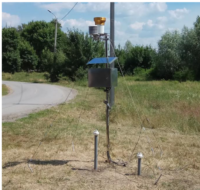
Рисунок 1 – Общий вид комплекса агрометеорологического АИП

Общий вид комплекса АИП представлен на рисунках 1 и 2.