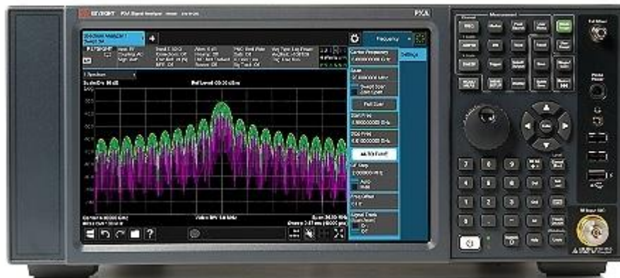
Рисунок 1 – Внешний вид анализаторов

Внешний вид анализатора приведен на рисунке 1.