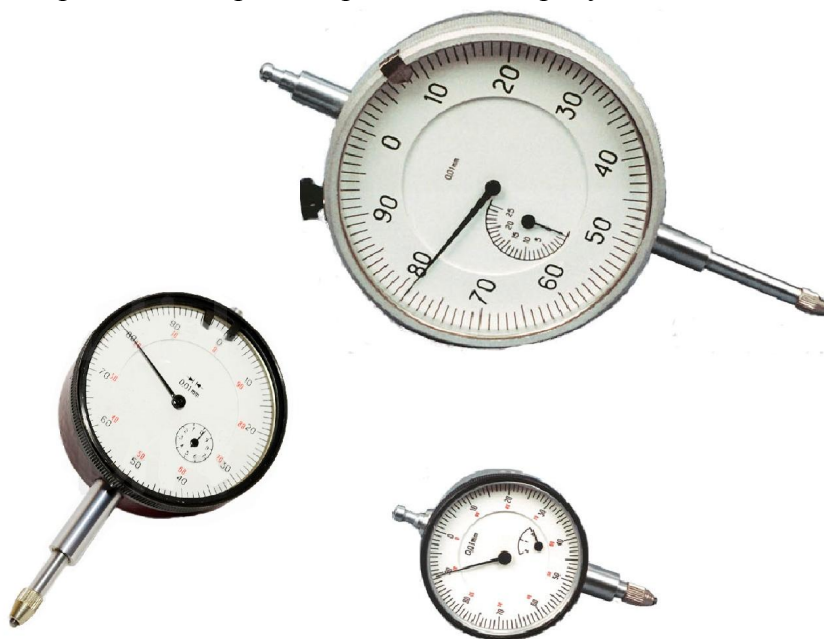
Рисунок 1 - Общий вид индикаторов часового типа ИЧ с ценой деления 0,01 мм

Общий вид средства измерений представлен на рисунке 1.