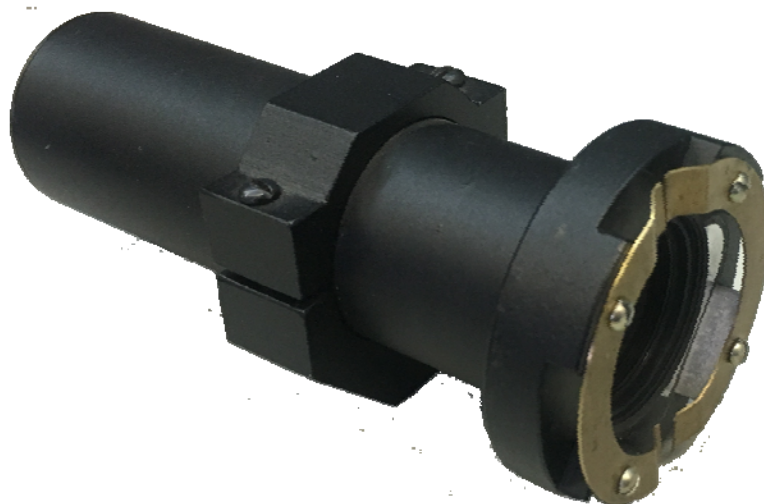
Рисунок 1 - Общий вид датчика

Общий вид датчика представлен на рисунке 1.