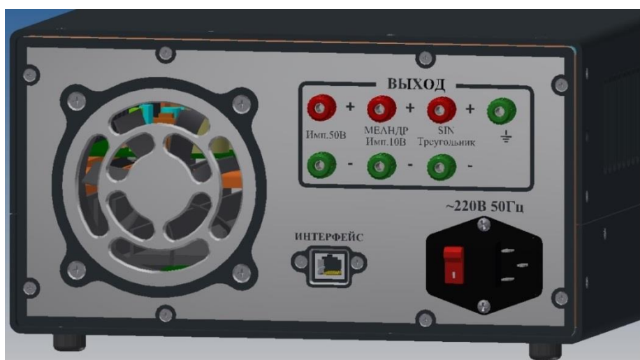
Рисунок 2 – вид задней панели