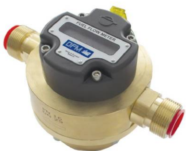
Р и с у н о к 1 – расходомеры DFM

д) дифференциальный без дисплея DFM 100DK, DFM 250DK, DFM500DK, DFM 100D232, DFM 250D232, DFM 500D232, DFM 100D485, DFM 250D485, DFM 500D485, DFM 100DCAN, DFM 250DCAN, DFM 500DCAN