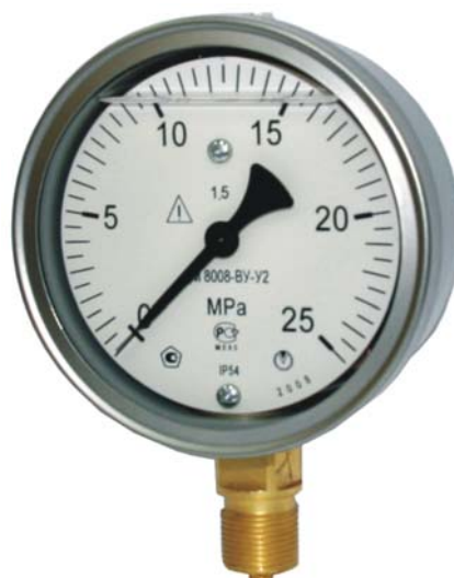
Рисунок 1 - Общий вид приборов