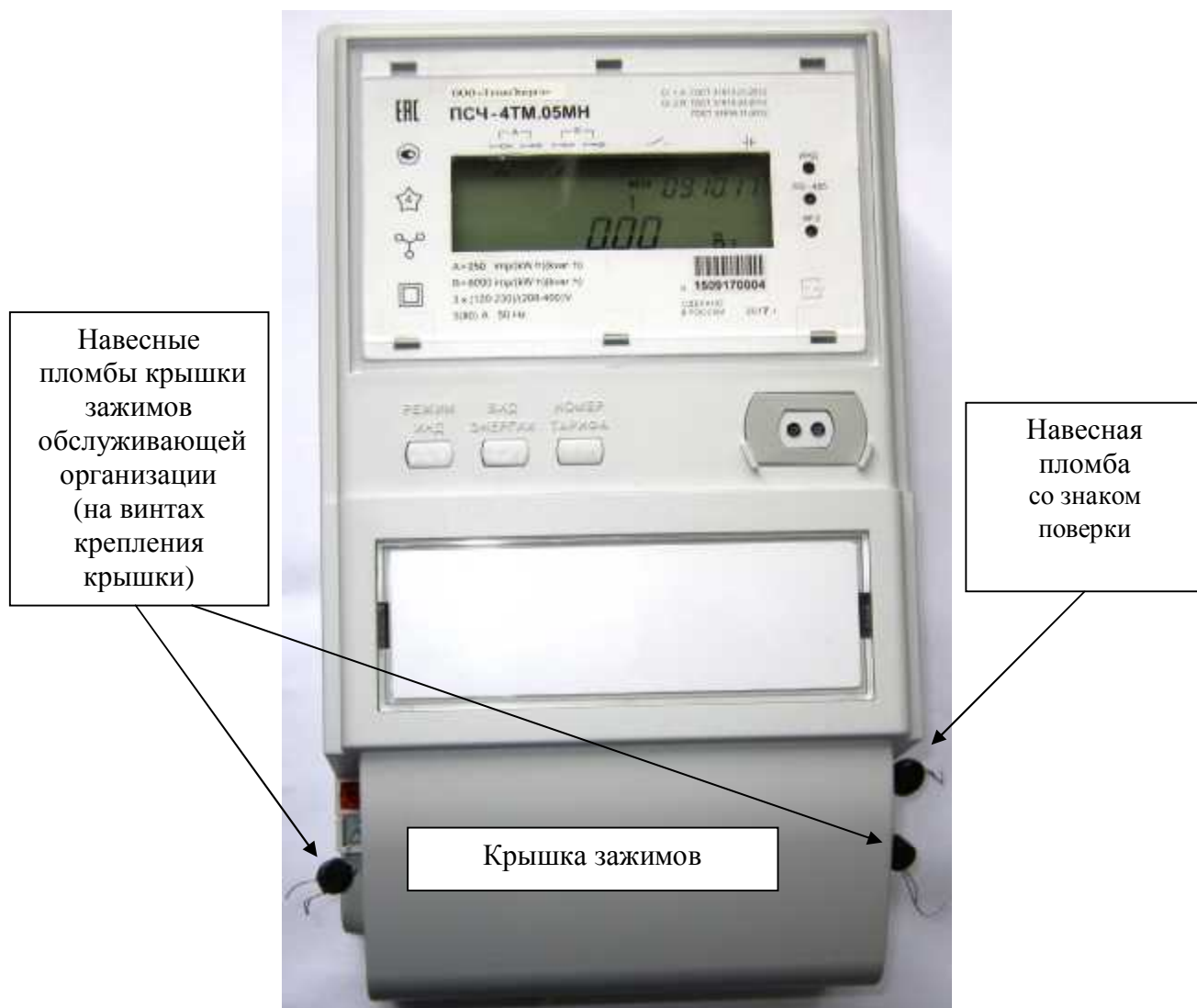
Рисунок 2 - Внешний вид счетчика внутренней установки с установленной крышкой зажимов, схема пломбирования от несанкционированного доступа, обозначение места нанесения знака поверки