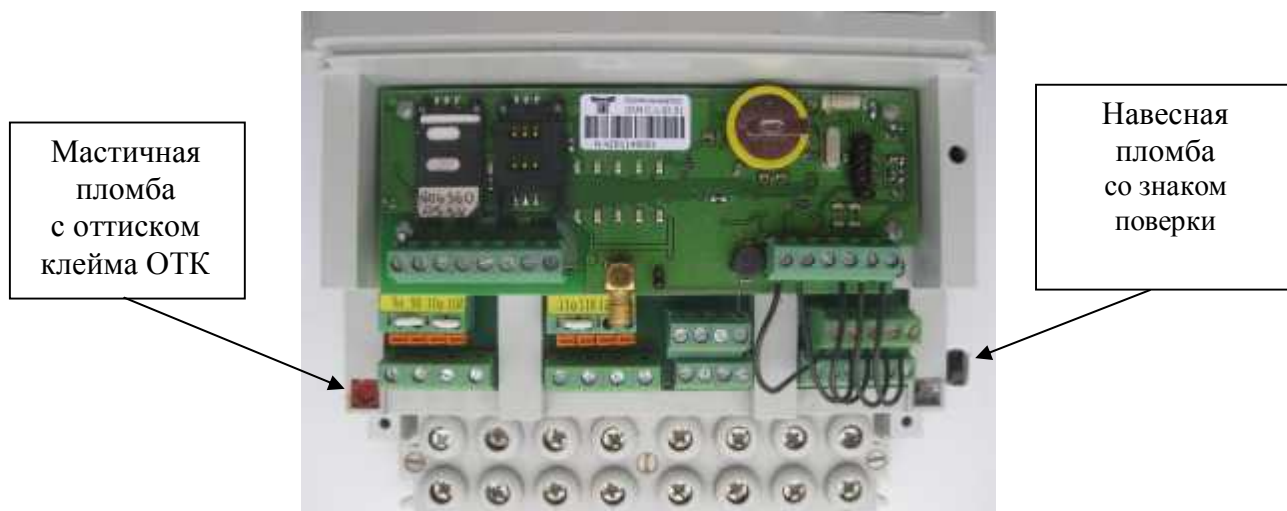
Рисунок 3 - Внешний вид счетчика внутренней установки со снятой крышкой зажимов