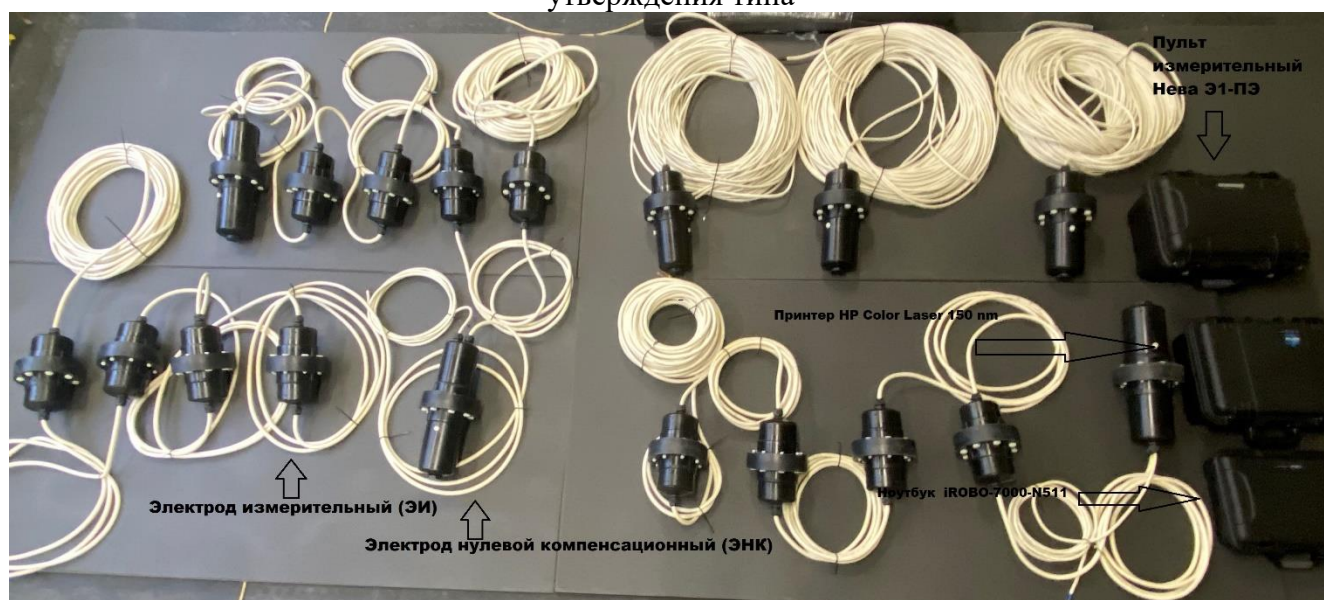
Рисунок 3 – Общий вид системы вместе с подводной частью