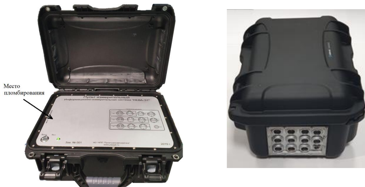
Рисунок 1 - Общий вид надводной части системы с указанием места пломбирования

Общий вид надводной части системы, места пломбировки от несанкционированного доступа и нанесения «Знака утверждения типа» изображены на рисунках 1 и 2. Общий вид системы вместе с подводной частью представлен на рисунке 3.