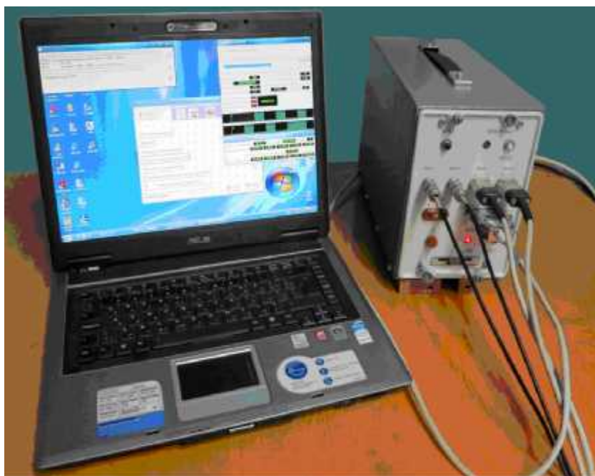
Рисунок 1 - Общий вид ИТИ1

Общий вид ИТИ1 представлен на рисунке 1.