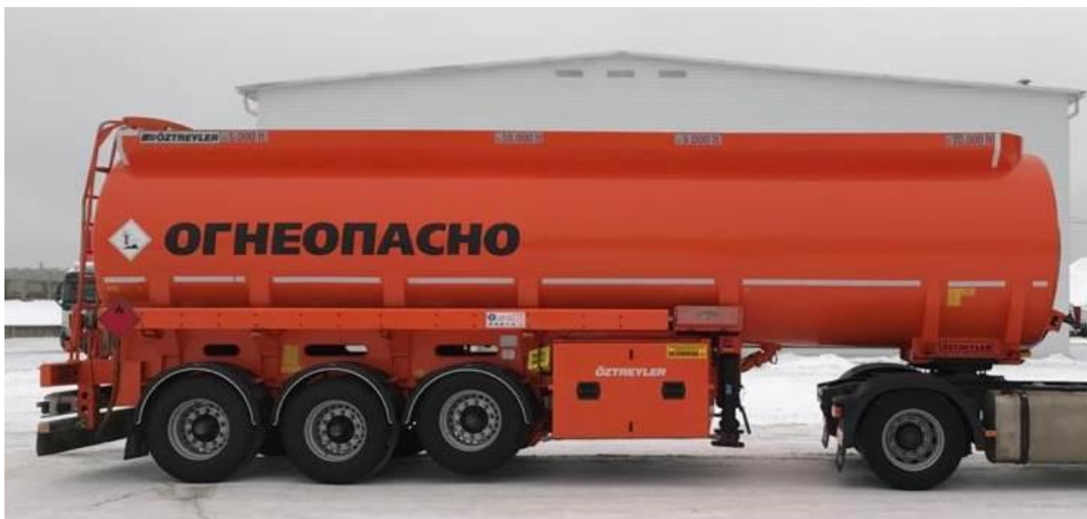
Рисунок 1 – Общий вид полуприцепа-цистерны OZTRAYLER OZT

Схема пломбировки для защиты от несанкционированного изменения положения указателя уровня налива, обозначение места нанесения знака поверки представлены на рисунке 2.