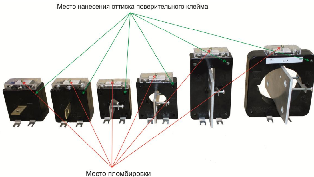
Рисунок 1 - Трансформаторы тока Т-0,66 УЗ

Для предотвращения доступа к вторичной обмотке и сердечнику трансформатора на корпусе в месте установки соединительных винтов корпуса предусмотрено место для нанесения оттиска поверительного клейма. Выводы вторичной обмотки трансформатора закрываются прозрачной пластиковой крышкой и пломбируются после установки трансформатора. Общий вид трансформаторов тока, места пломбировки и нанесения оттиска поверительного клейма изображены на рисунках 1 и 2.