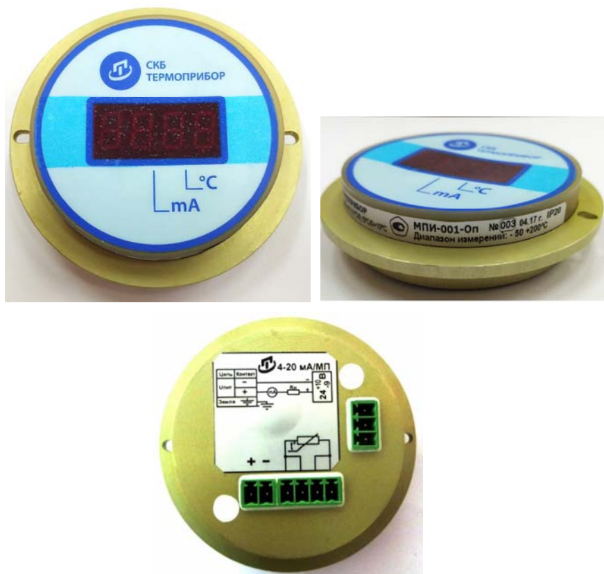
Рисунок 2 - Преобразователи измерительные модели МПИ-001