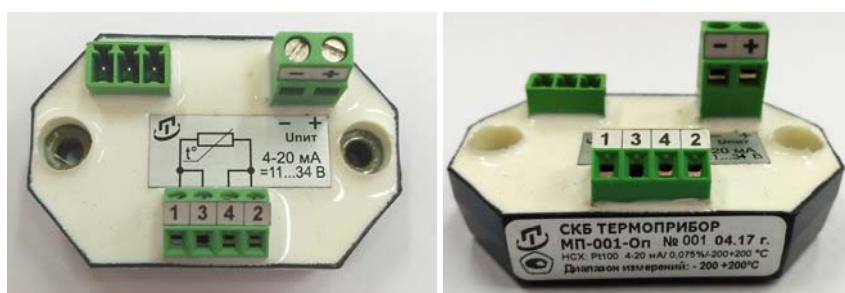
Рисунок 1 - Преобразователи измерительные модели МП-001

Фотографии общего вида ПИ представлены на рисунках 1 - 4.