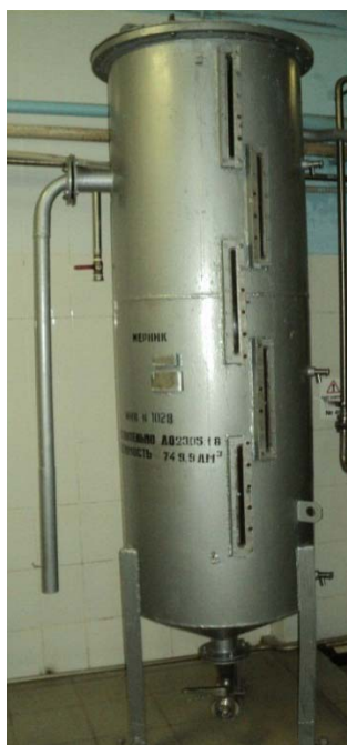
Рисунок 1 - Общий вид мерников металлических технических 1-го класса К7-ВМА

Общий вид мерников металлических технических 1-го класса К7-ВМА представлен на рисунке 1.