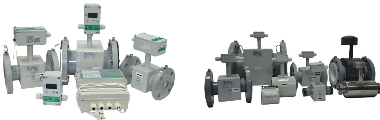
Рисунок 1 - Общий вид расходомеров-счетчиков электромагнитных РСЦ

Общий вид расходомеров-счетчиков электромагнитных РСЦ приведен на рисунке 1.