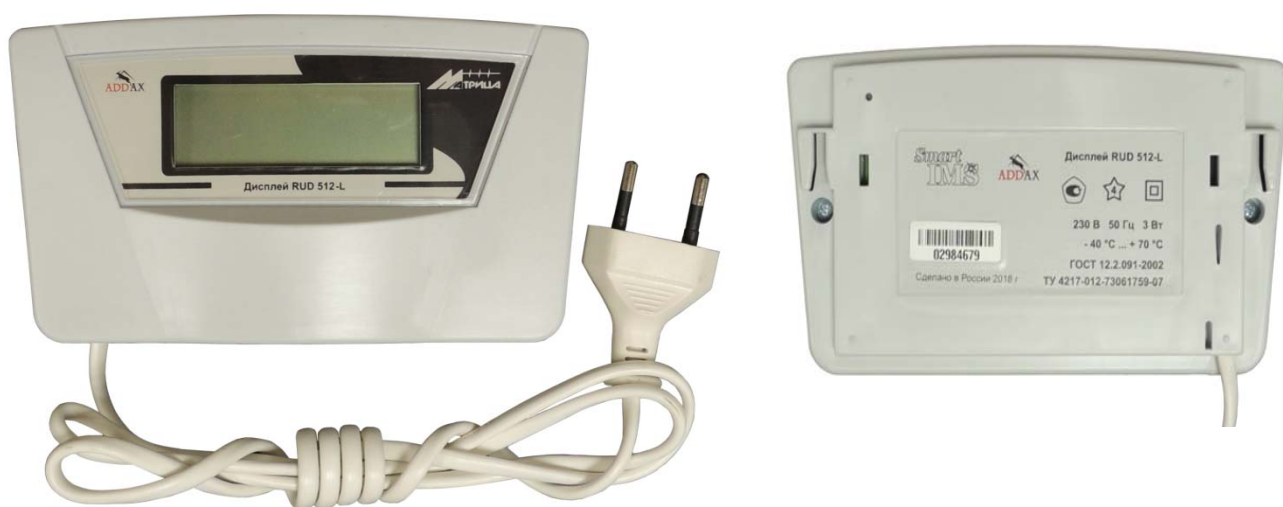
Рисунок 2 - Общий вид удаленного дисплея RUD 512-L