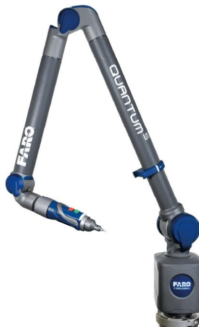
Рисунок 1 - Общий вид машины шестиосевой модификации модели FARO Quantum S

Опломбирование корпуса машин от несанкционированного доступа не предусмотрено.