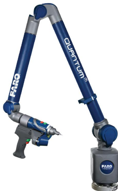
Рисунок 2 - Общий вид машины семиосевой модификации модели FARO Quantum M с внешним лазерным сканером FARO Laser Line Probe HD