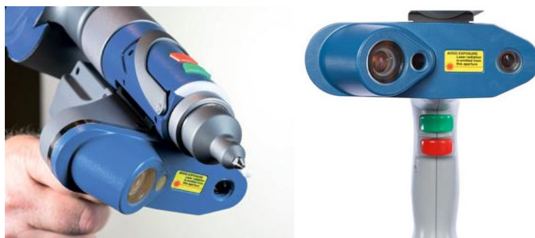
Рисунок 3 - Внешний вид лазерного сканера FARO Laser Line Probe HD