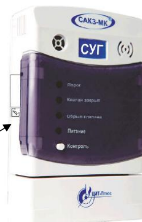
Рисунок 6 - Место установки пломбы сигнализатора исполнения СЗ-3-1ГТ