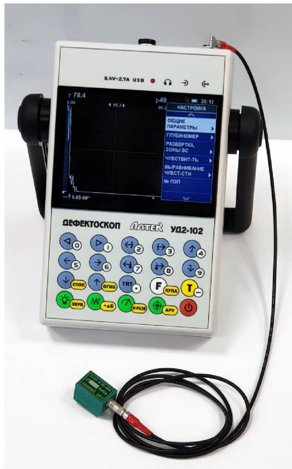
Рисунок 1 – Общий вид

БЭ включает в себя устройство обработки, приемо-возбудитель, клавиатуру и дисплей. Фотография общего вида дефектоскопа представлена на рисунке 1