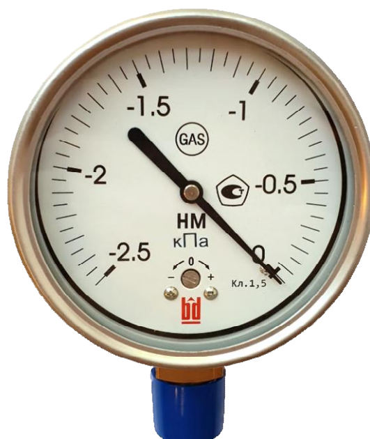
Рисунок 2 – Общий вид тягомера