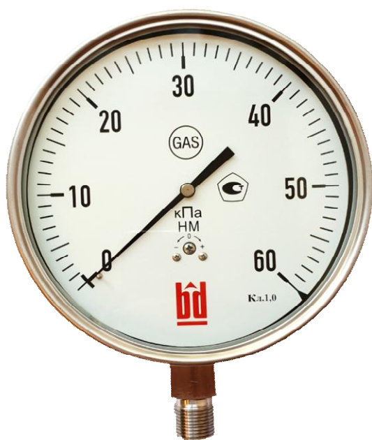
Рисунок 1 – Общий вид напоромера

Общий вид приборов представлен на рисунках 1, 2 и 3.