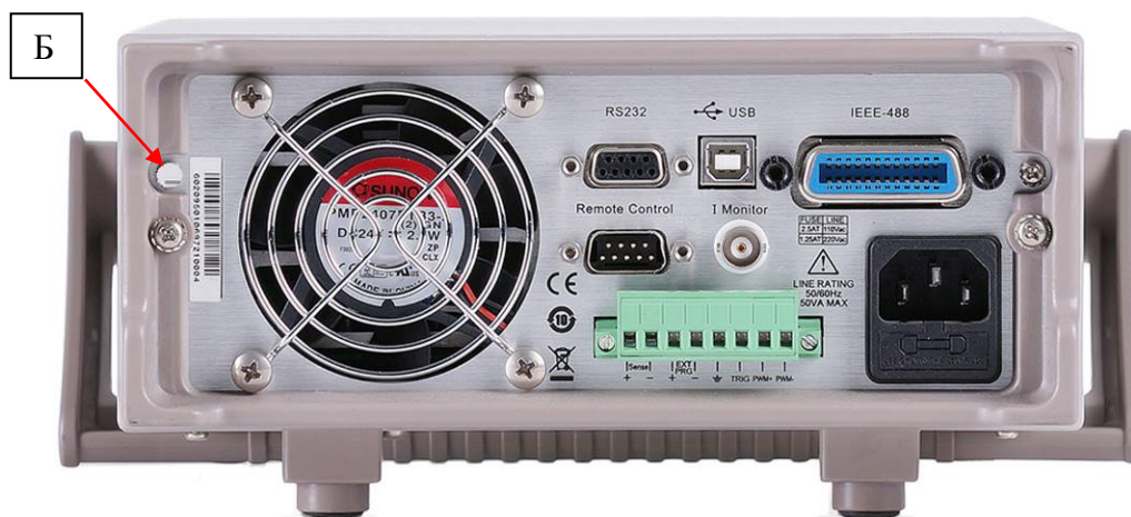
Рисунок 5 – Схема пломбировки от несанкционированного доступа (Б)