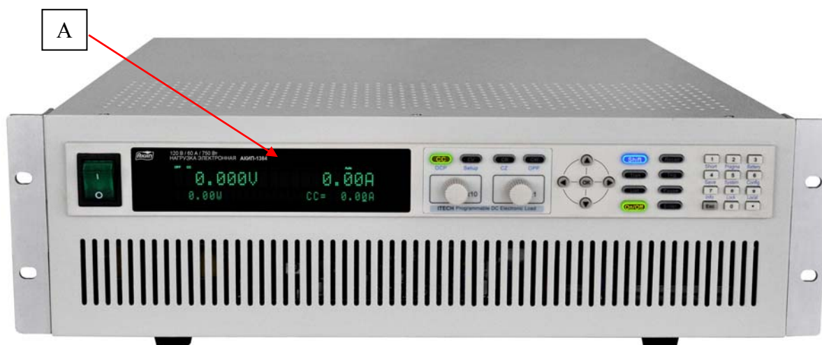
Рисунок 3 – Общий вид нагрузок модификаций АКІП-1384, АКІП-1384/1, АКІП-1384/2, АКІП-1384/3, АКІП-1384/4, АКІП-1384/5 и схема нанесения знака утверждения типа (А)