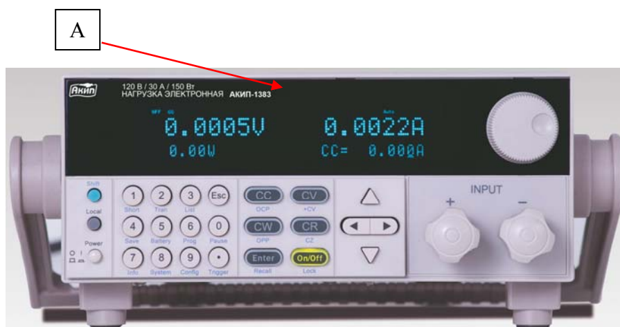
Рисунок 1 – Общий вид нагрузок модификаций АКІП-1380, АКІП-1380/1, АКІП-1383, АКІП-1383/1, АКІП-1383/2, модели АКІП-1386 и схема нанесения знака утверждения типа (А)