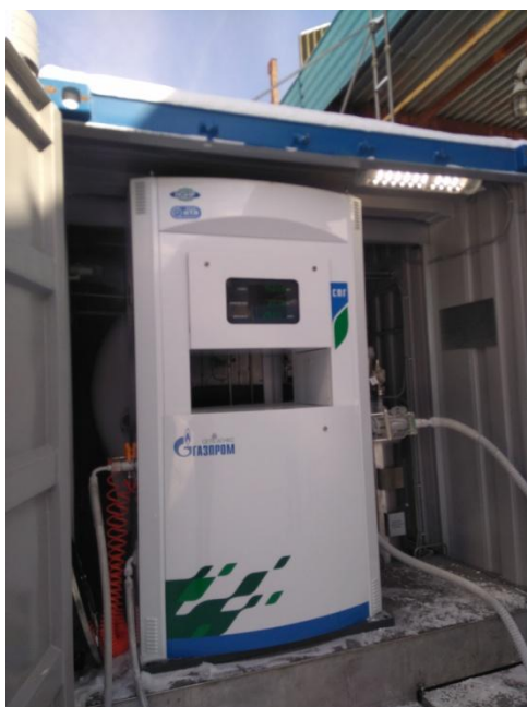
Рисунок 1 – Общий вид колонки

Схема пломбировки от несанкционированного доступа и обозначение места нанесения знака поверки представлена на рисунке 2. Схема пломбировки предотвращающая доступ к элементам конструкции колонки представлена на рисунке 3. Защитный кожух электронного блока колонки опломбирует завод изготовитель или организация, выполняющая ремонт (рисунок 3).