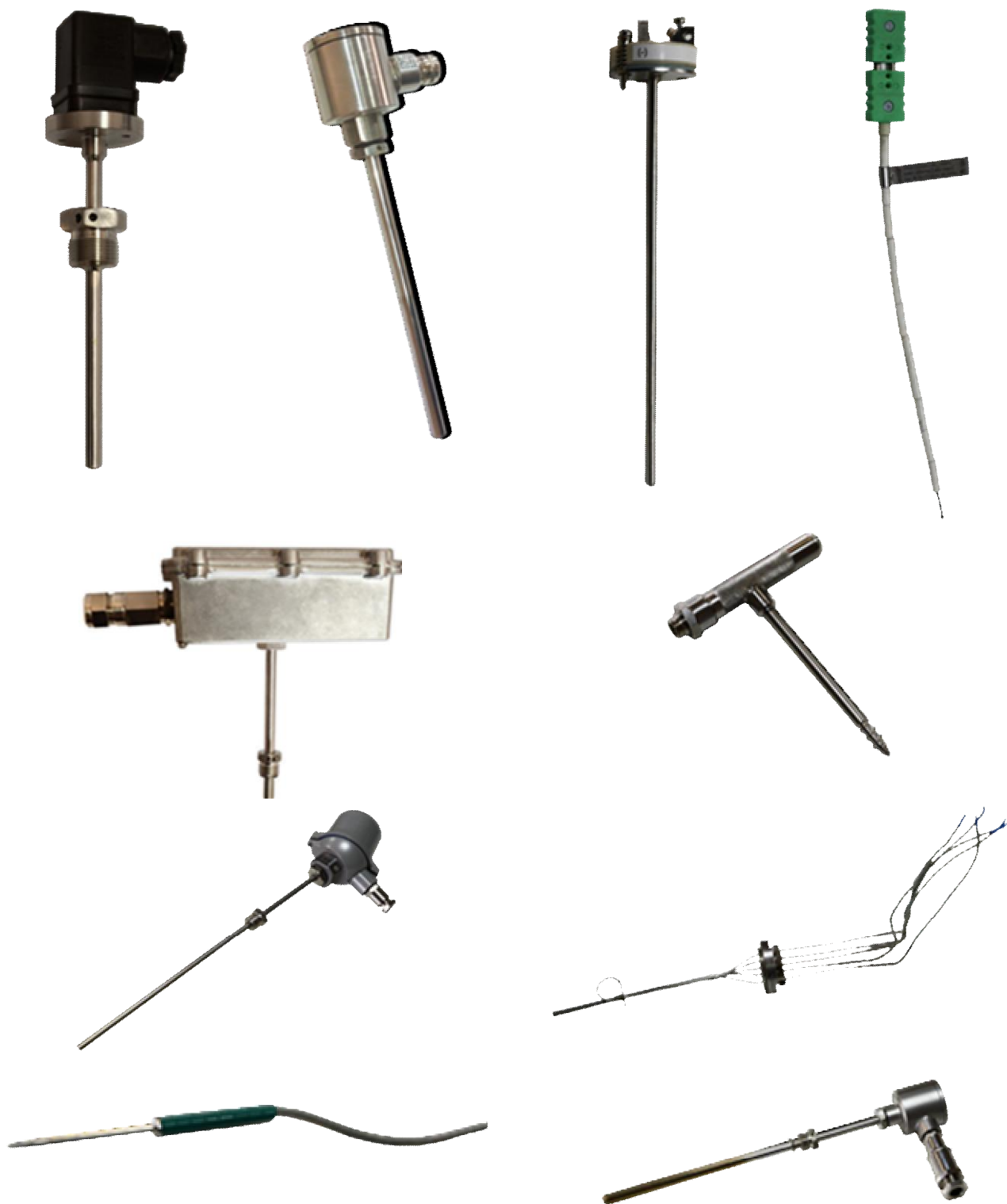
Рисунок 1 – Общий вид преобразователей термоэлектрических ТП-Б