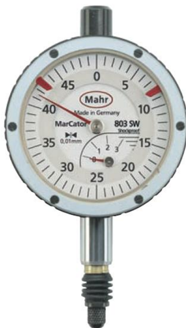
Рисунок 4 – Общий вид головок MarCator 803 SW