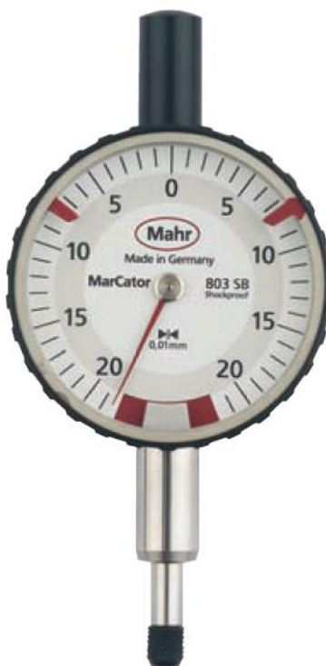
Рисунок 5 – Общий вид головок MarCator 803 SB