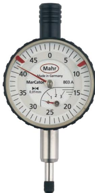
Рисунок 1 – Общий вид головок MarCator 803 A

Общий вид головок показан на рисунках 1-5.