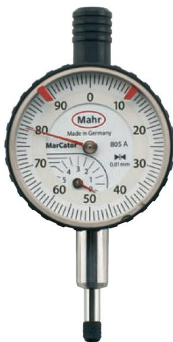
Рисунок 2 – Общий вид головок MarCator 805 A